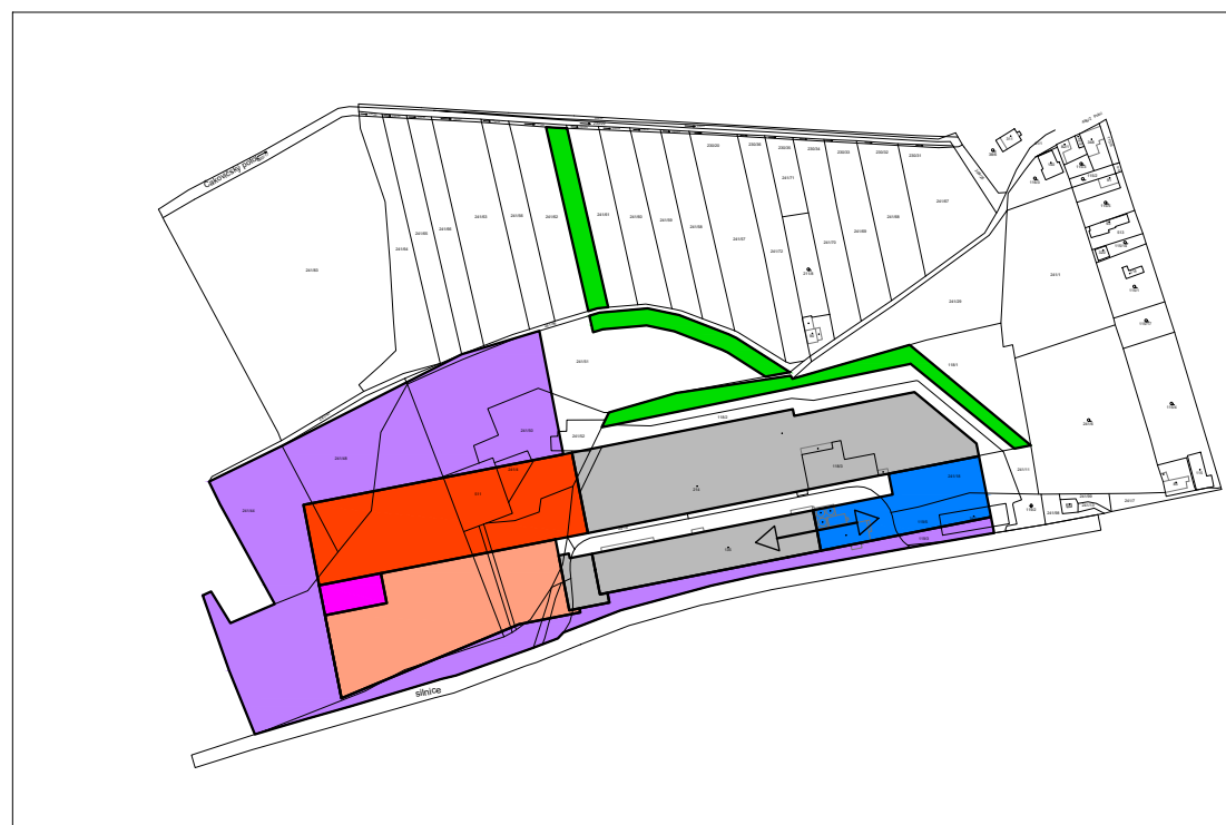
SCHÉMA PODMÍNEK PROSTOROVÉHO USPOŘÁDÁNÍ ÚZEMÍ VYBRANÝCH PLOCH PRO NERUŠÍCÍ VÝROBU A SKLŽBY (VL)